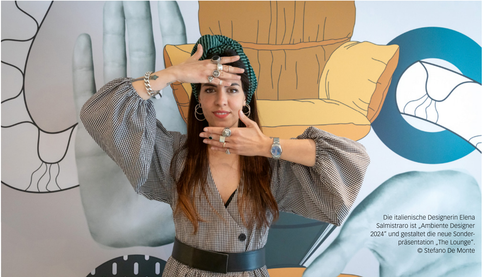
Die italienische Designerin Elena Salmistraro ist „Ambiente Designer 2024“ und gestaltet die neue Sonderpräsentation „The Lounge“.