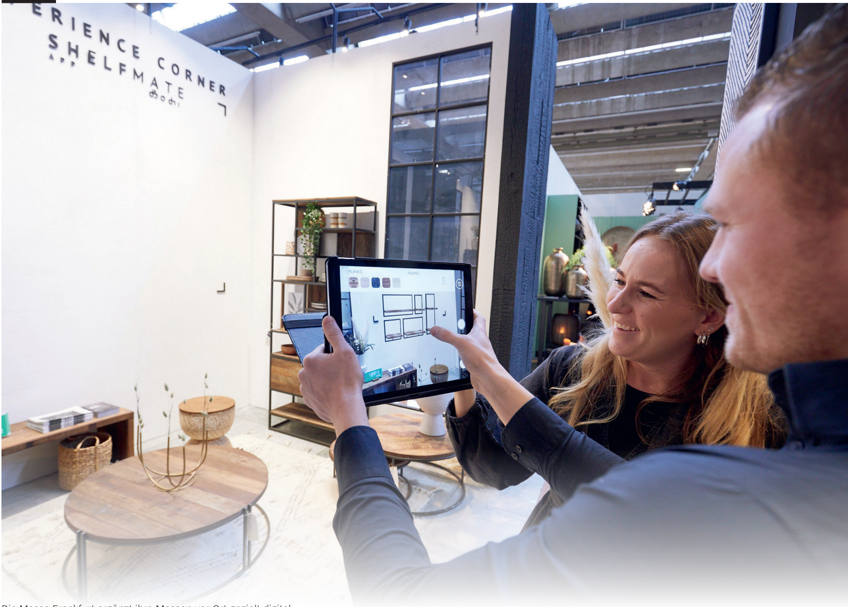
Die Messe Frankfurt ergänzt ihre Messen vor Ort gezielt digital.