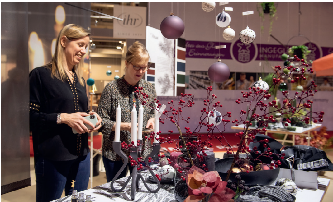
Auch 2023 werden die Trendinszenierungen zu den Highlights der drei Messen Ambiente, Christmasworld und Creativeworld zählen.

+ www.ambiente.messefrankfurt.com , www.christmasworld.messefrankfurt.com , www.creativeworld.messefrankfurt.com