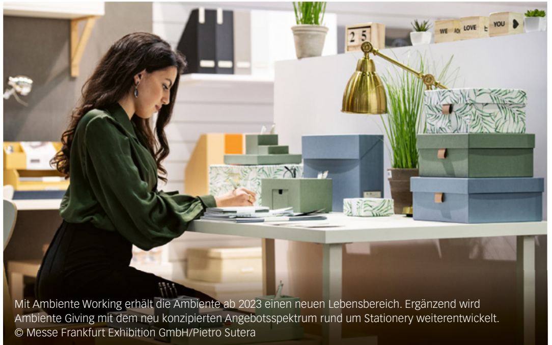
Mit Ambiente Working erhält die Ambiente ab 2023 einen neuen Lebensbereich. Ergänzend wird Ambiente Giving mit dem neu konzipierten Angebotsspektrum rund um Stationery weiterentwickelt.