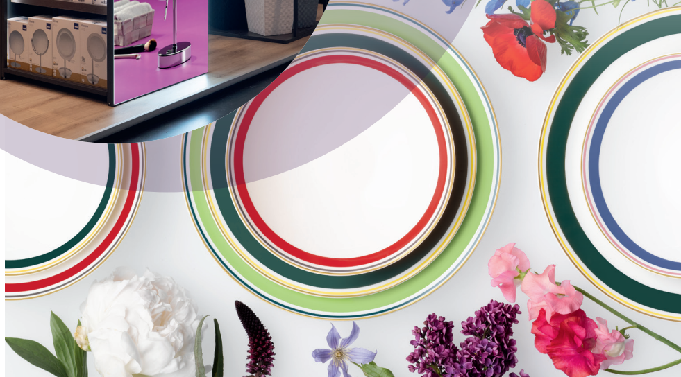
Neuheiten für den gedeckten Tisch zeigen wir ab Seite 32.