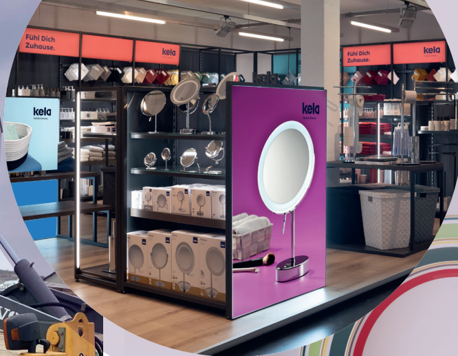
Viel Neues gibt es von kela zu berichten. Mehr dazu in unserem Unternehmensporträt auf den Seiten 50 und 51.