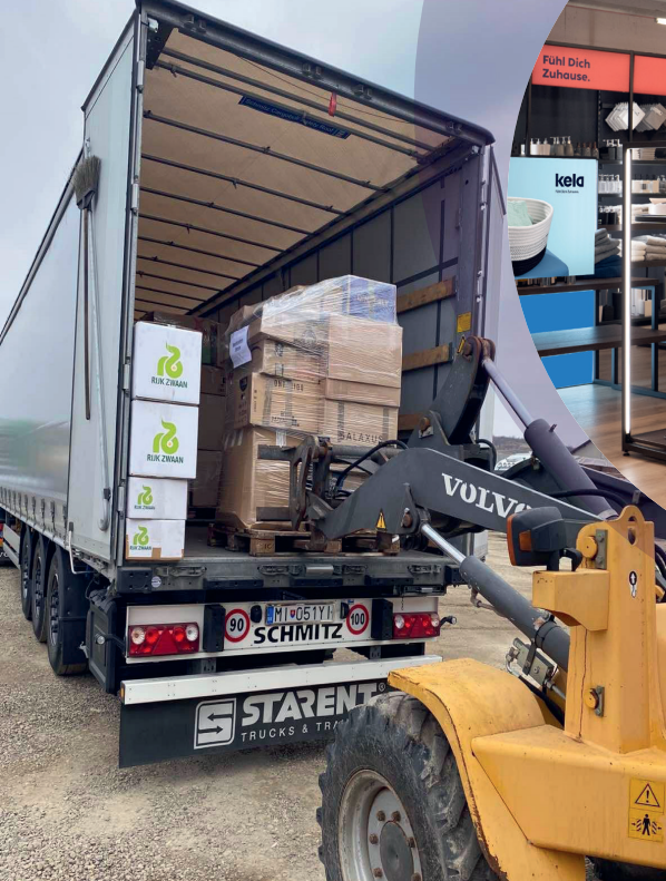
Der Krieg in der Ukraine hat eine Welle der Hilfsbereitschaft ausgelöst. Wir berichten auf den Seiten 14 und 15.